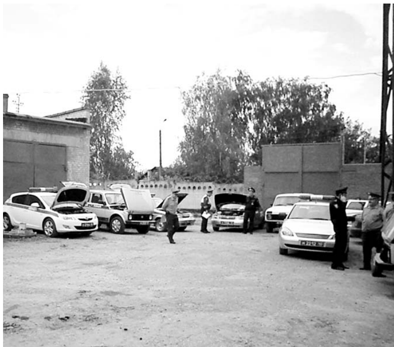
кое состояние машин. Делают это придирчиво, не упуская ни одного момента.

Он начинается. Калужские гости по очереди проверяют документы коллег-водителей, документы автотранспортного средства, техничес-